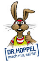
Bild: Dr. Hoppel

Auf folgender Seite finden Sie den Abschlussbericht "Dr. Hoppel- Mach mit, sei fit! Kinder in Form- Gemeinsam begeistern,