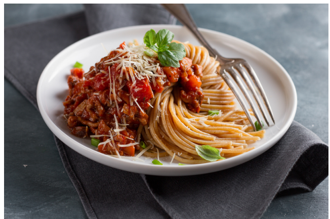
Linsenbolognese mit Bandnudeln.