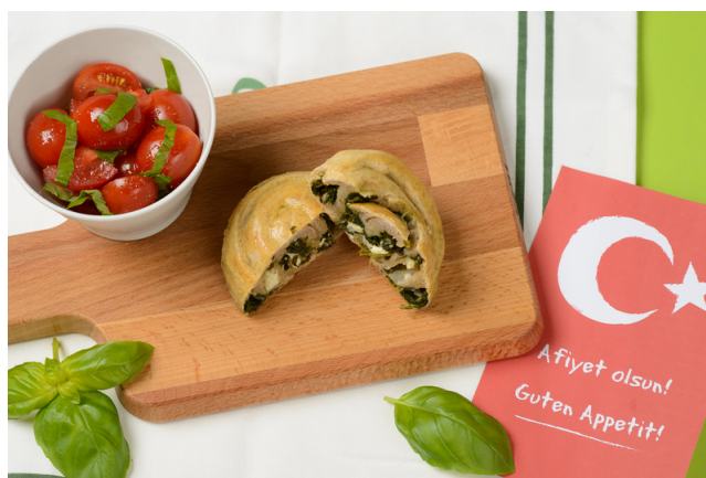
Börekschnecke mit Spinat-Schafskäsefüllung.