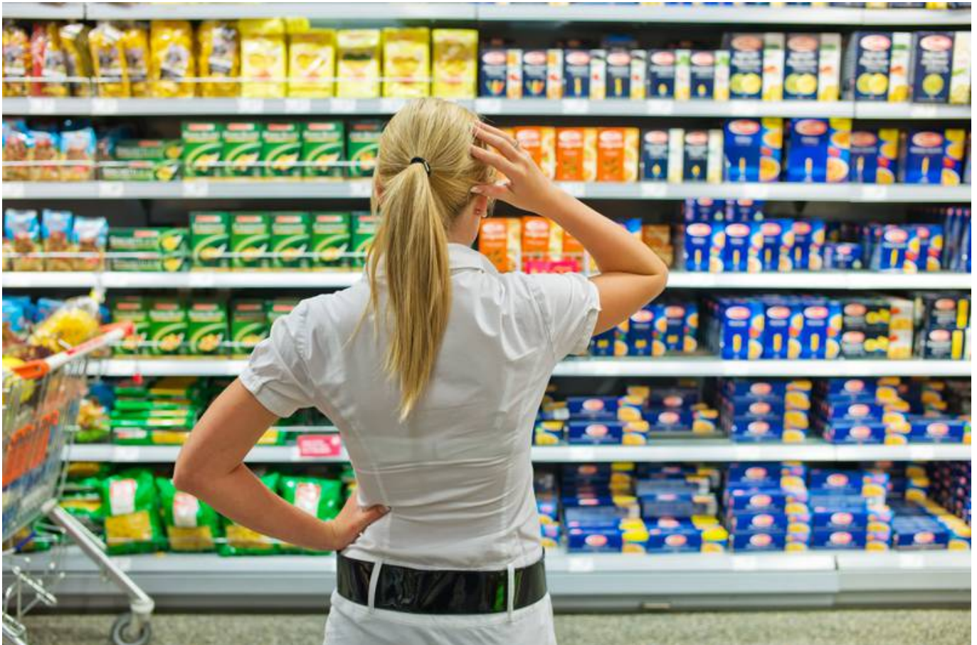
Wer die Wahl hat.

EU-Öko-Logo, Gentechnik-frei-Label oder Fairtrade-Siegel - auf Lebensmittelverpackungen begegnen wir täglich verschiedenen Gütesiegeln. Was sagen uns diese Siegel eigentlich und können wir ihnen vertrauen?