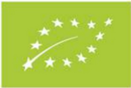
Das EU-Öko-Label.

Das deutsche Bio-Siegel gibt es schon seit 2001. Es ist eine freiwillige Kennzeichnung für verpackte und unverpackte Bio-Produkte. Beim EU-Öko-Logo handelt es sich hingegen um eine Pflichtkennzeichnung für vorverpackte Bio-Lebensmittel, die innerhalb der Europäischen Union hergestellt wurden.